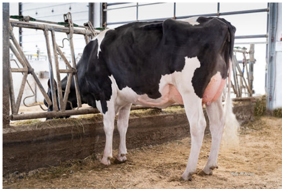
HAELZLE DENIM LAVA

MISS ELEGANT DELIGHT VG-88-2YR-USA DOM 3*