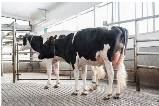
HAELZLE DENIM LAVA